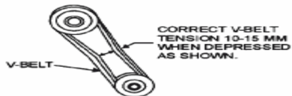
Рисунок 2. Натяжение клинового рем